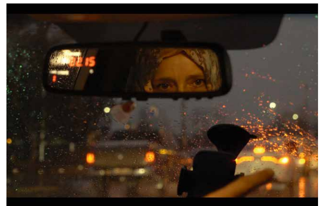
STILL: TAKSI SPIEGEL