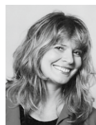
Petra Hoffmann AG DOK