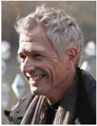
Thomas Riedelsheimer Filmemacher