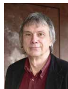
Thomas Frickel AG DOK