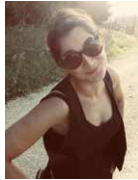
S. 09 Livia Romano S. 17 Kamerafrau